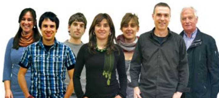
UDAL GOBERNU TALDEA