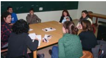
Berbataldeak osatzen hasteko bilera.